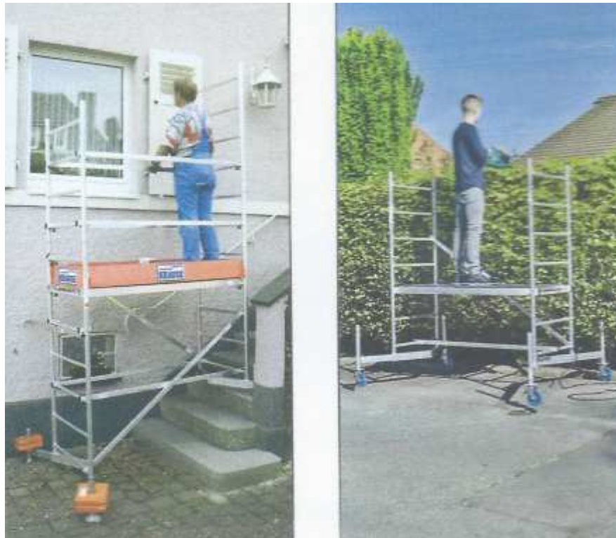
1 st aluminium arbetsställning KRAUSE-system

Inköp under 2021 och som kommer att läggas in på hemsidan: